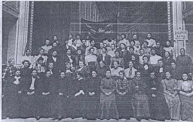
På syfabriken Linnéa arbetade några av klubbens medlemmar vid sekelskiftet.

Klubbens medlemmar tillhörde inte den fattigaste delen av befolkningen. Over hälften hade egen lägenhet utan inneboende eller med en